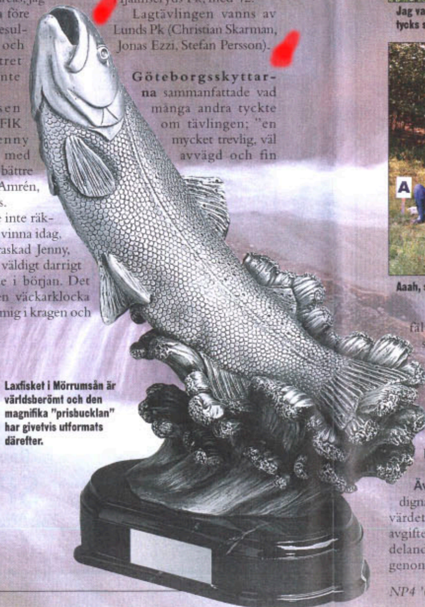
Laxfisken i Mörrumsån är världsberömt och den magnifika "prisbucklan" har givetvis utformats därefter.

Göteborgsskyttarna sammanfattade vad många andra tyckte om tävlingen; "en mycket trevlig, väl avvägd och fin