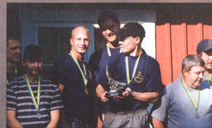
Trångt på pallen. Segrande lag Lunds Pk flankerade av Sp Ljungby (vä) och Lönsboda Psk (hö).

förande, likt föregående år, utdelningen efter en annorlunda modell. Normalt är ju de flesta prisbord redan indelade för respektive klass och vapengrupp. Pk Eken fördelade priserna på så sätt att alla pristagarna själva fick välja det man ville ha. Ingen indelning i klasser eller vapengrupper. Ordningen på pristagarna avgjordes av antalet starter i de olika klasserna. Ett helt nytt grepp som uppskattades av alla, inte minst av pristagarna själva.