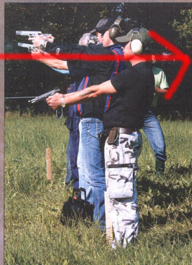
Jag var snabbast, så en liten paus hinner jag med innan nästa visning tycks skytten i förgrunden tänka.